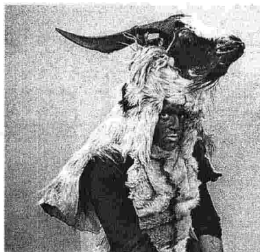
Album A sinistra, una foto dal reportage di Enrico Sacchetti al Museo della Scienza. Sopra, «Album sardo» di Ula Tirso; sotto, «Luce e riflessi» di Matteo Cazzani