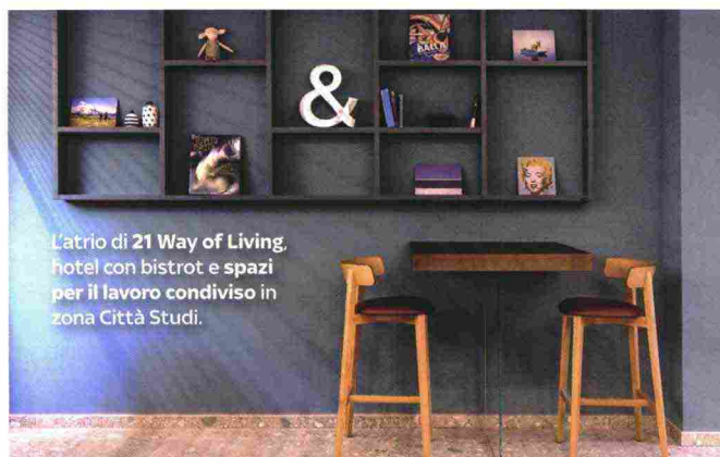
L'atrio di 21 Way of Living, hotel con bistrot e spazi per il lavoro condiviso in zona Città Studi.