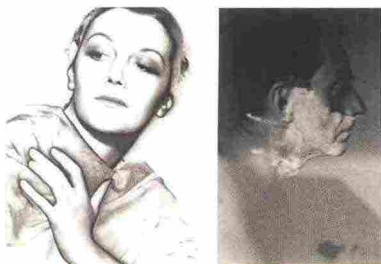
Foto a sinistra, Solarised Portrait (thought to be Meret Oppenheim) , Parigi, 1932. A destra, Man Ray shaving , 1929.

Surrealist Lee Miller è la prima personale italiana dedicata all'autrice che soleva dire "Preferisco fare una foto, che essere una foto". Lanciata da Condé Nast sulla copertina di Vogue nel 1927, Lee Miller diventa una delle modelle più apprezzate dalle riviste di moda e dai fotografi come Edward Steichen. Ma il suo animo irrequieto e libero la porta