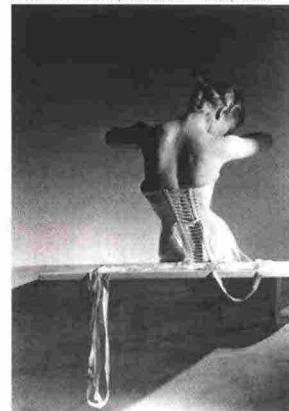
Foto Horst P. Horst, Mainbocher Corset, 1939.