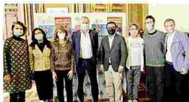
La presentazione della Monza Music Week, nata per affiancare il concorso internazionale Rina Sala Gallo e sopravvissuta agli eventi (covid) nonostante l'annullamento della sfida internazionale di pianoforte

Il primo evento sarà tutto da vedere: sabato 3 ottobre si inaugurerà in Galleria Civica la mostra fotografica dedicata alla musica inserita nella quindicesima edizione della rassegna "Photofestival" che sarà per la prima volta a Monza. Domenica 4 è in programma uno dei momenti più