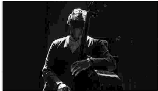
L'orchestra La Verdi di Milano che suonerà in duomo e sopra uno scatto della mostra della Galleria civica coinvolta per la prima volta nel Photofestival . Sotto una passata edizione di Mille chitarre in piazza