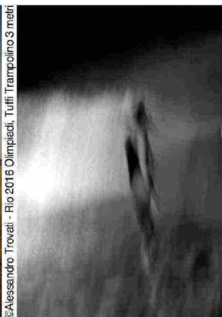
Rio 2016 Olimpiadi, Tuffi Trampolino 3 metri

QUANTITÀ E QUALITÀ "Scenari, orizzonti, sfide. Il mondo che cambia". La XV a edizione di Photofestival ospita il vasto quanto prezioso contributo di autori di fama internazionale, fotografi professionisti e talenti emergenti.