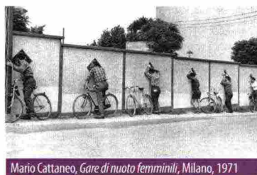
Mario Cattaneo, Gare di nuoto femminili , Milano, 1971

Lo scorso anno il Circolo Fotografico Milanese, tra i fondatori della FIAF - Federazione Italiana Associazioni Fotografiche - ha compiuto 90 anni d'attività. Bloccate le celebrazioni a causa della situazione pandemica, festeggia quest'anno la ricorrenza con una mostra fotografica accompagnata da un libro che ne ripercorre la storia. L'archivio del circolo raccoglie migliaia di fotografie tra le quali sono state selezionate le 180 stampe della mostra che raccontano Milano dagli ultimi decenni del secolo scorso fino alle settimane della pandemia. La mostra è completa da filmati, documenti, libri, fotocamere legati alla storia del circolo.