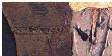
Alberto Burri, Sarca , 1955. Courtesy Fondazione Palazzo Albizzini Collezione Burri ©Fondazione Palazzo Albizzini Collezione Burri. Foto Alessandro Sartheanesi

Nel corso delle loro vite, Giacomelli e Burri hanno avuto l'occasione di incontrarsi più volte, a partire dal 1966 per intercessione del pittore Nemo Sartheanesi. Ne nacque un rapporto di reciproca stima che probabilmente favorì delle ricerche artistiche comuni, indagate e messe in risalto da questa mostra, con un nucleo di fotografie che Mario Giacomelli dedicò ad Alberto Burri e a Nemo Sartheanesi. La mostra prende in esame il legame tra le poetiche e gli stili dei due grandi artisti del Novecento, creando un dialogo fra pittura e fotografia, nel quale ben si inserisce un'opera pittorica che Giacomelli realizzò prima di lasciare i pennelli per dedicarsi completamente alla fotografia.