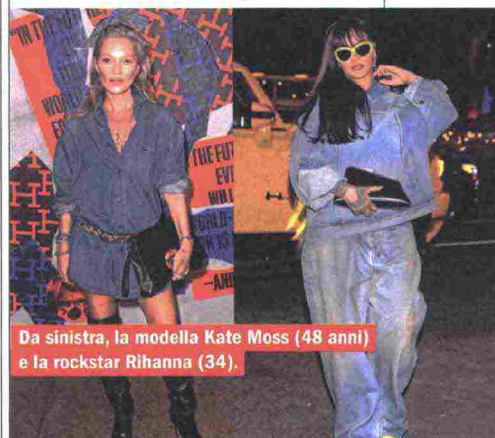
Da sinistra, la modella Kate Moss (48 anni) e la rockstar Rihanna (34).

Ritaglio stampa ad uso esclusivo del destinatario, non riproducibile.