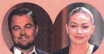
Leonardo DiCaprio (47 anni) e Gigi Hadid (27 anni).

COPPIA SPLENDIDA Bello lui. Bellissima lei. E, secondo i gossip, sempre più vicini. Leo e Gigi fanno davvero coppia? Prepariamoci a foto da urlo.