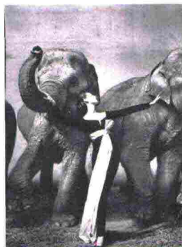
Da sinistra, uno scatto di Richard Avedon e la foto Il divenire dei quadrati di Nicolò Quirico.

Fino al 31 ottobre, Milano ospita la 17ª edizione del Photofestival , la più ricca e importante rassegna meneghina dedicata alla fotografia d'autore. Quest'anno, con il titolo Ricominciare dalle immagini. Indagini sulla realtà e sguardi interiori , la rassegna invita a soffermarsi sull'importanza delle immagini (appunto) per osservare il mondo e noi stessi con occhi diversi, recuperando una normalità mai apprezzata come ora. In mostra ci sono gli scatti di grandi nomi. Ma anche di artisti emergenti, che vale assolutamente la pena scoprire. Info: milanophotofestival.it ,