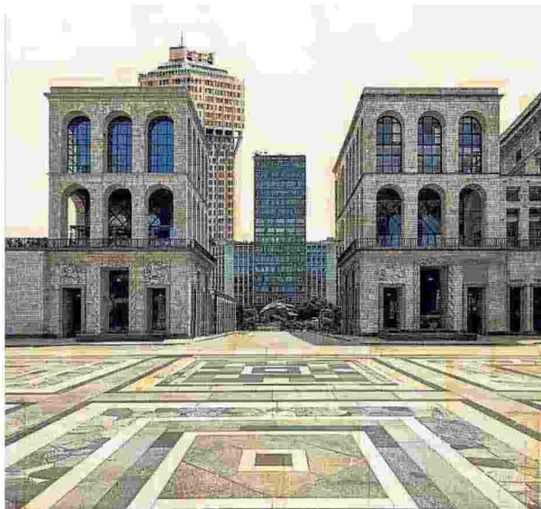
▲ Nicolò Quirico Il divenire dei quadrati