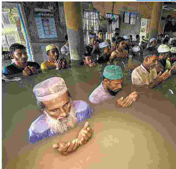
▲ Sharwar Apo Bangladesh

L'Asia di Terzani, l'emergenza climatica, Polillo e Monti, ma anche l'umanità dell'Idroscalo: un mese di esposizioni sulla fotografia d'autore