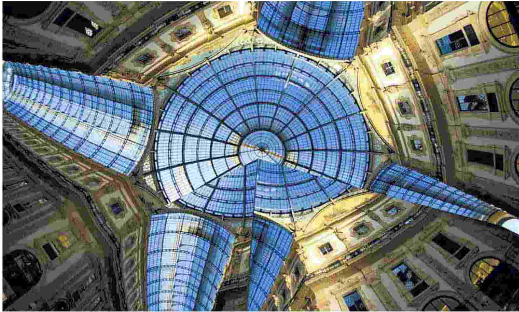
▲ In Galleria "Un, due, tre, Milano!", è uno dei temi della manifestazione