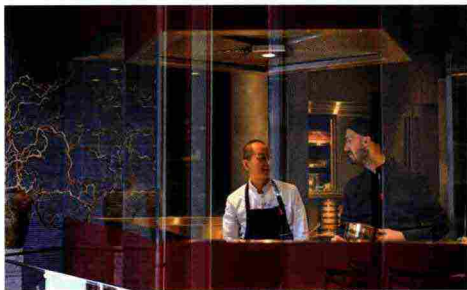
A sinistra La cucina a vista del Ba Restaurant , zona De Angeli, che propone ricette della tradizione orientale. A destra Il bistrot Una Cosa , in zona Ticinese.