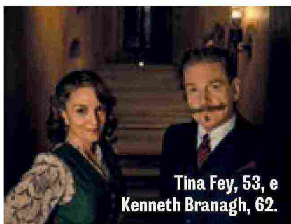
Tina Fey, 53, e Kenneth Branagh, 62.