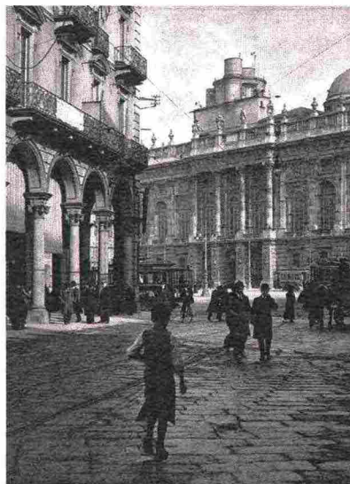
Archivio Storico Torino

Dall'archivio storico della città, 200 foto stupefacenti (a destra, l'osservatorio astronomico di Palazzo Madama); comune.torino.it/archivistorico